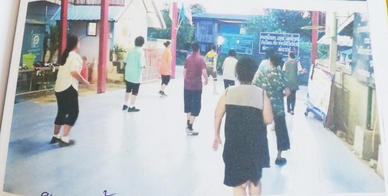
๑ ๒ เจ้าอาวาส ๓๓๓๐๖ ๓๓๐๖๖๖๖ ๓๓๐๖๖๖๖