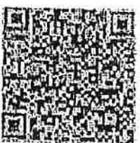
สื่อประชาสัมพันธ์

กลุ่มงานวิชาการ สำนักงานส่งเสริมการปกครองท้องถิ่น โทร./โทรสาร ๐ ๕๓๑๕ ๐๑๓๖ - ๗ ๖๗๔๖๕ ไปรษณีย์อิเล็กทรอนิกส์ : cri@cgd.go.th