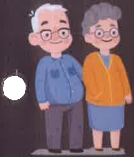
ผู้สูงอายุ