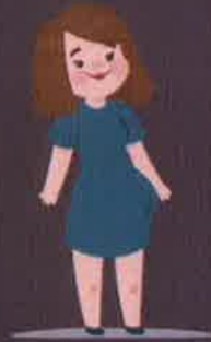
หญิงตั้งครรภ์