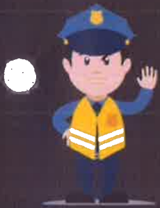
ตำรวจจราจร