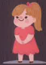
เด็กเล็ก