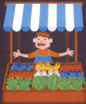
พ่อค้าแม่ค้าริมทาง