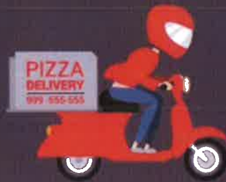
คนขี่รถ จักรยานยนต์รับจ้าง