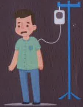
ผู้ป่วยด้วยโรคประจำตัว