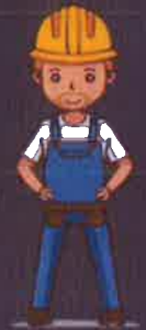
คนงานก่อสร้าง

DDC กรมควบคุมโรค Department of Disease Control